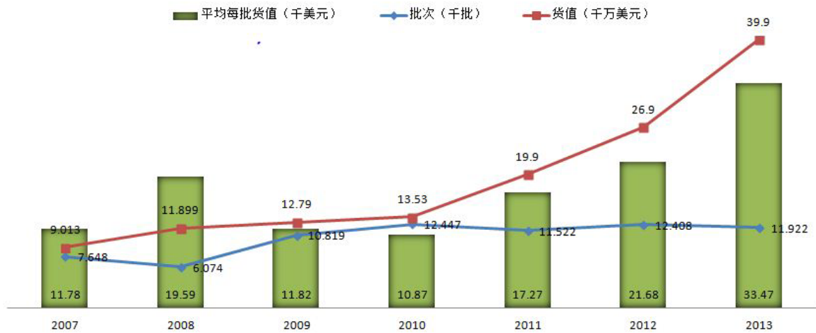
图 1: 2007 年-2013 年进口数据对比图

进口地区主要集中在我国沿海的上海、广州、深圳、北京、珠海、厦门等口岸，进口批次占全国进口产品批次的 93.47%，进口货值占全国进口货值的 97.37%。我国玩具主要消费群体仍集中在经济发展水平较为领先的东南沿海地区。由图 1 中 2007 年-2013 年玩具进口玩具情况可知，平均每批进口玩具的货值逐年上升，随着消费能力的提升以及消费者对品牌的认知，国际知名品牌的中高端玩具纷纷进入中国市场，而且经过多年的探索推广以及网络营销的便利，国际品牌的营销网络已初具规模。2008 年和 2013 年是近年进口玩具的两个高峰，前者是欧美等国家经济环境欠佳的年份，国际品牌商集中精力投入开发中国市场，因此进口量剧增，而 2013 年具有龙年效应，是传统中国生育高峰，因而 2013 年是近年进口量最高的年份。此外，由于中国已放开单独生二胎，而这部分人群又主要集中在城市，他们对玩具的品